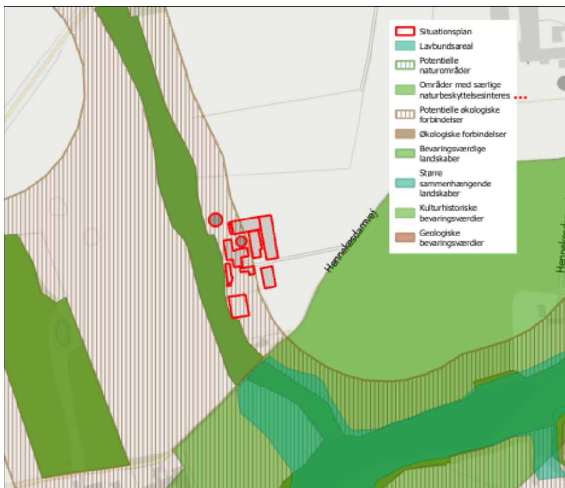
Figur 2. Anlæggets placering i landskabet.