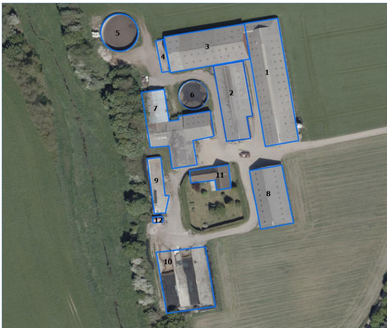
Figur 1. Husdyrbrugets driftsbygninger.